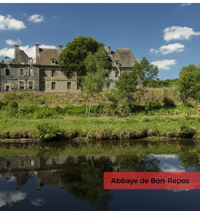
Abbaye de Bon-Repos