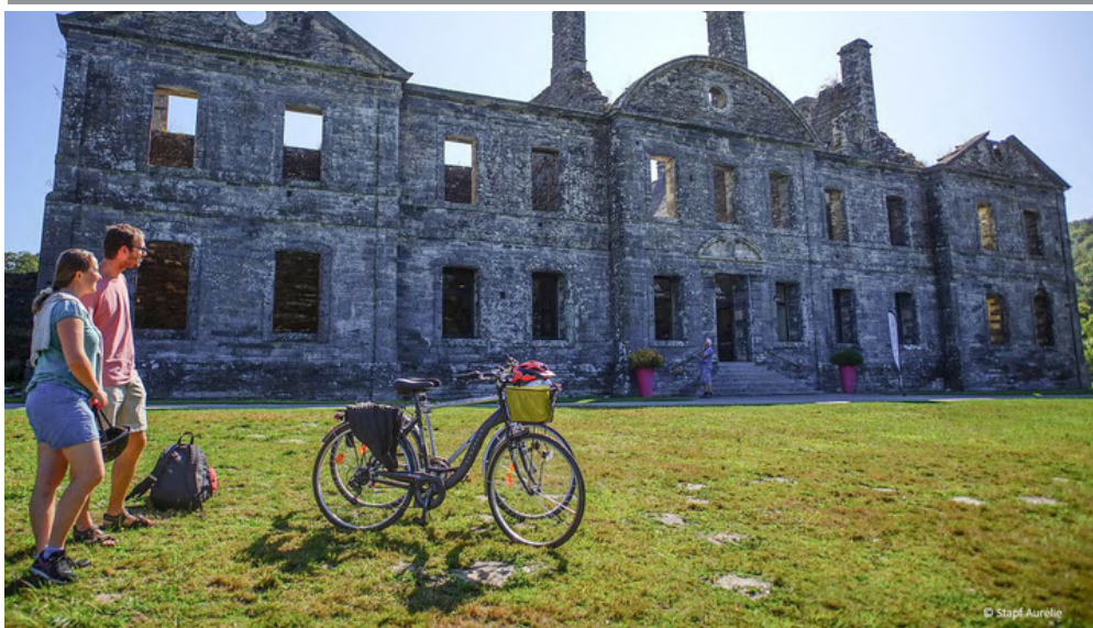
Abbaye de Bon-Repos

Le centre de la Bretagne vous ouvre son cœur dans cette boucle itinérante le long de deux de ses artères cyclables. Le bonheur n'existe que s'il est partagé, alors emmenez votre partenaire à dos de vélos pour un week-end romantique. Vous trouverez ici, l'occasion de vous relaxer et de vous retrouver entre amoureux à travers la beauté des paysages, le calme des promenades et la curiosité des patrimoines.