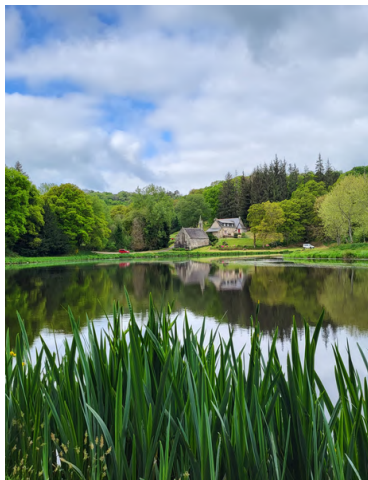
Chapelle Notre-Dame de Pitié, Mellionec