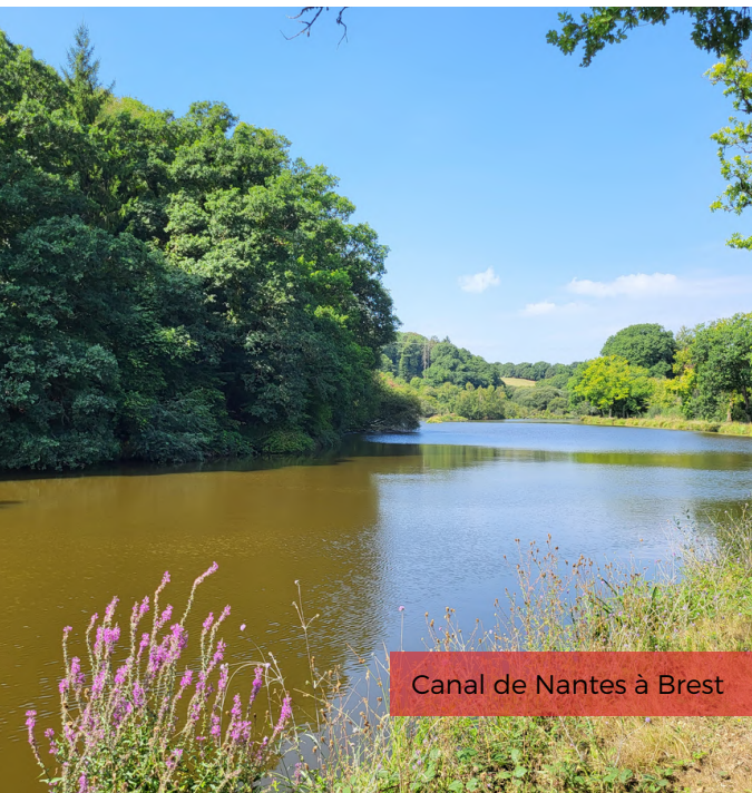
Canal de Nantes à Brest